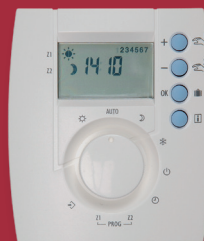
Boîtier de programmation

Le gestionnaire MDE convient parfaitement pour une installation simple et rapide d'accumulateur(s) grâce à un bus spécial 1 fil.