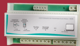
Boîtier modulaire (gestionnaire MDE)